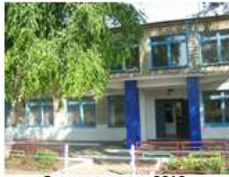
Здание школы 2013