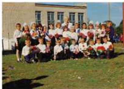
Выпускники начальной школы 1997г