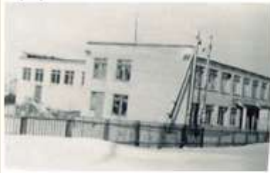
Здание школы 1971 г.