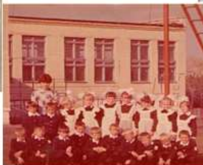
Выпускники начальной школы 1986г