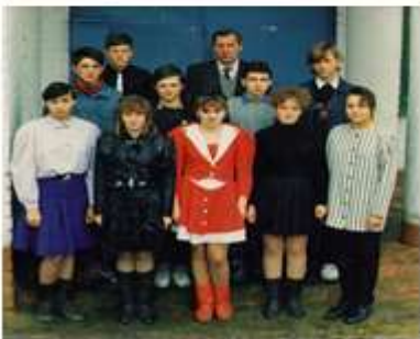
Выпускники 1990г. ,